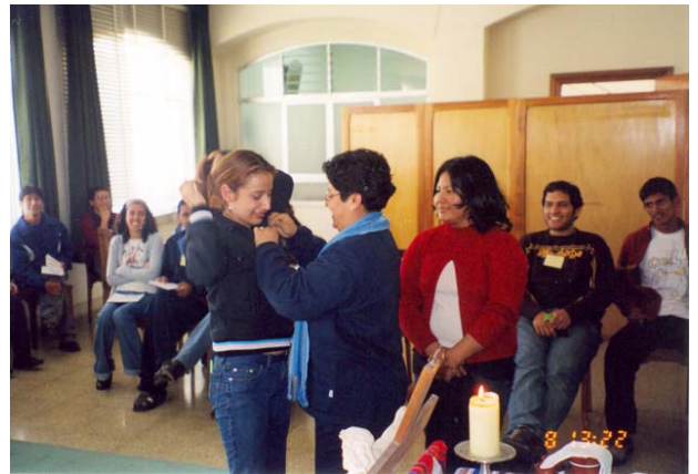
Jóvenes recibiendo recuerdo, al término de sus seis retiros

Y, ahora, descubrir ¿qué es lo que quiere Dios de mí?. Siento que es una pregunta muy compleja, difícil de contestar porque es una responsabilidad muy grande, y porque contemplar, vivir y anunciar al mundo el amor de Dios no es nada fácil. Sé que es difícil por todos los obstáculos que se presentan pero no imposible; además, con fe y amor a Dios todo se puede.