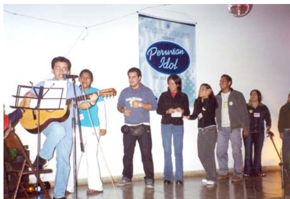
Noche de talentos

Luego de ponernos en ambiente, pasamos al momento de la oración donde se presencié una escenificación: dos discípulos de Jesús recordaban todas las hazañas del Maestro y terminaron recordando todos los encuentros de la pastoral juvenil. Inmediatamente se realizó «la feria» donde cada sector presentó sus comunidades. La novedad de este momento fue que las casas de formación también tuvo su espacio. Fue novedoso y muy bueno, porque permitió que los jóvenes nos conozcan y sepan que también somos jóvenes como ellos que hacemos una experiencia de Dios (al igual que ellos) descubriendo nuestra vocación religiosa para servir.