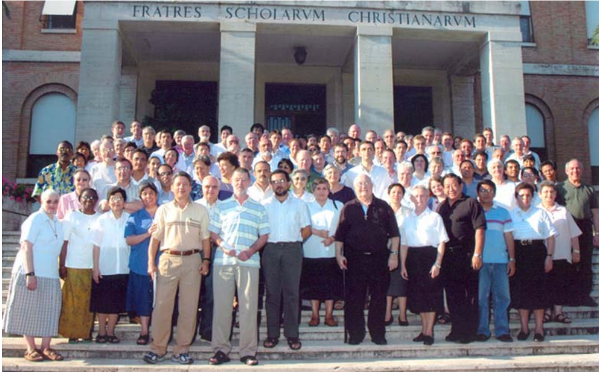
Hermanos y Hermanas participantes de los Capítulos Generales - Roma

Del 2 al 29 de septiembre nos reunimos en Roma los superiores y los delegados de los países donde está presente nuestra Congregación. Lo primero que constatamos es que somos una Congregación pequeña pero extendida, cerca de mil religiosos en más de 30 países en todos los continentes. Sin duda, esta diversidad constituye una riqueza para todos, pero también un desafío de cara a una misión común ss.cc.