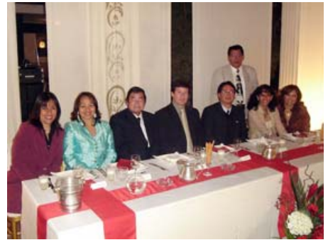
Personal Administrativo y Profesores en la Cena Institucional por 103 Aniversario del Colegio ss.cc. Recoleta

¡Feliz 113 años Recoleta y que sigan siendo muchos más!