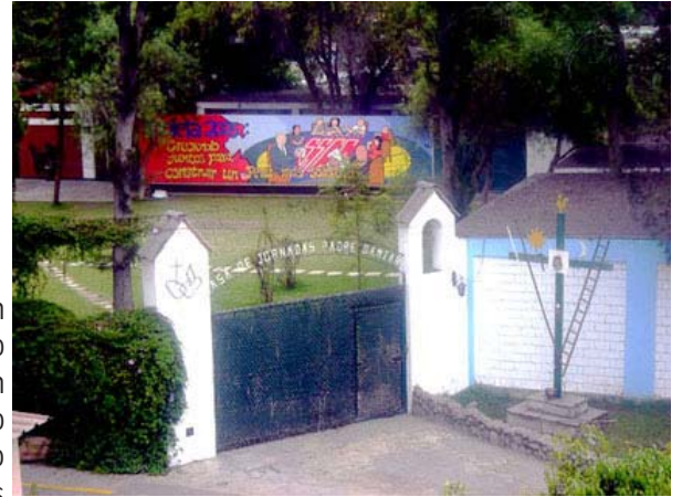
Ingreso a la casa de jornadas P. Damián

Pronto las Jornadas de Primaria y Secundaria la fueron dando vida, los equipos de docentes que empezaron a reunirse en ella, los encuentros de padres de familia, la preparación de la Confirma los fines de semana, empezamos a