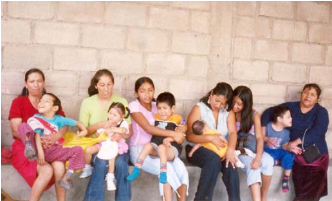
Programa para niños discapacitados