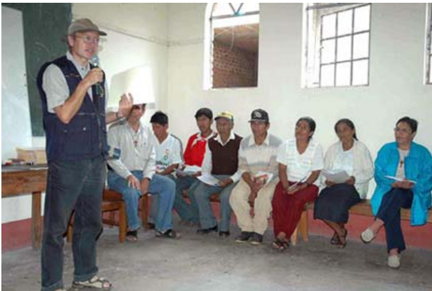
Asamblea de animadores en San Juan del Oro