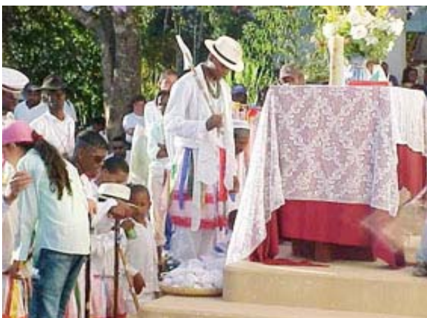
Eucaristía en Congado

«...El Corazón de Jesús está abierto a todos los corazones y a todas las culturas»