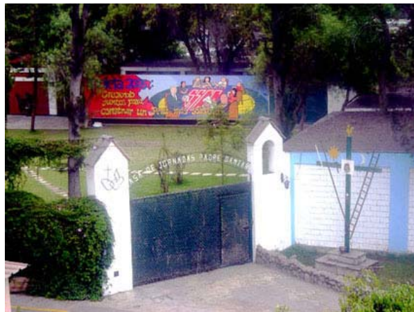
Ingreso a la casa de jornadas P. Damián

Pronto las Jornadas de Primaria y Secundaria la fueron dando vida, los equipos de docentes que empezaron a reunirse en ella, los encuentros de padres de familia, la preparación de la Confirma los fines de semana, empezamos a