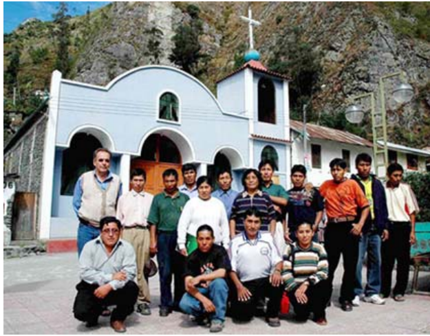
Grupo de Animadores en el IFP. de Sandia

todavía alumno de la secundaria, siguiendo la huella de varias de sus hermanas mayores y animado por el P. Francisco. San Lorenzo no tiene escuela, los niños van a la escuela de Quiquira. La mayoría de los pobladores tiene casa en este centro poblado. Algunos vecinos están sólo en el tiempo de la cosecha en el sector, la mayor parte del año