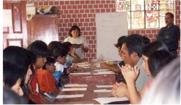
Taller de formación integral para jóvenes

Paralelamente y con el mismo objetivo nació hace cinco años el programa de «Prevención del pandillaje y de las drogas», dirigido a niños/as y