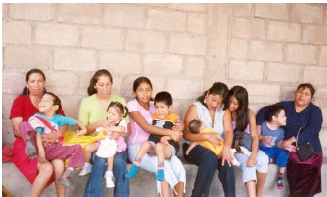
Programa para niños discapacitados